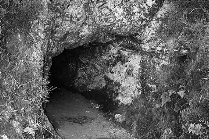
Entrada a un dos Buratos dos Mouros do Pico Sacro.

Oculta habitación de cobardes moros, depósitos de numerosas y encantadas riquezas y otros epítetos de esta natureza, prodigan comunmente al Pico sagro los habitantes de sus faldas.