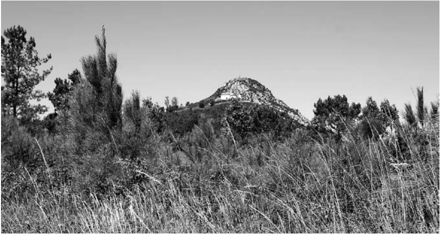
Cumio do Pico Sacro, coa capela de San Sebastián. Foto: Henrique Neira, 2014.

do que el denomina unha mina, que popularmente chamamos aínda hoxe «Burato dos Mouros», e da que indica que se comunicaba co río Ulla. Aínda existía daquela un castelo na cima do monte e Del Hoyo explica como se construíu anos antes o segundo dos Buratos dos Mouros 12 :