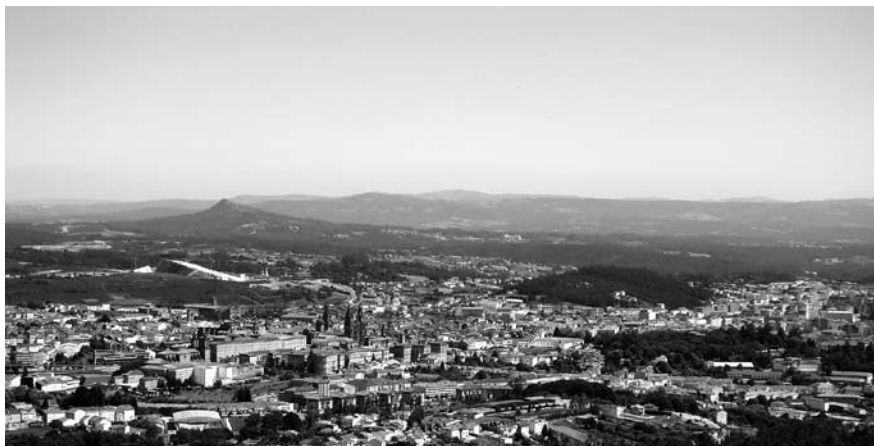
O Pico Sacro e parte do Val do Ulla, xunto coa cidade de Santiago, vistos desde o monte Pedroso compostelán.

é de ouro: é a súa figura na paisaxe da Ulla que se albisca desde os Camiños de Santiago; son os episodios da historia galega que se desenvolveron nel ou na súa contorna, as lendas, as creacións culturais nas que aparece ou que inspirou, e mesmo, por que non, a súa utilidade para a predición meteorolóxica como recollen coplas e refráns como «Cando o Pico coce, chove» O Pico Sacro é sen dúbida un dos grandes tesouros destas terras que cruza o río da Ulla, e del xa dixo Ramón Otero Pedrayo que era o cumio máis belo e simbólico de Galicia.