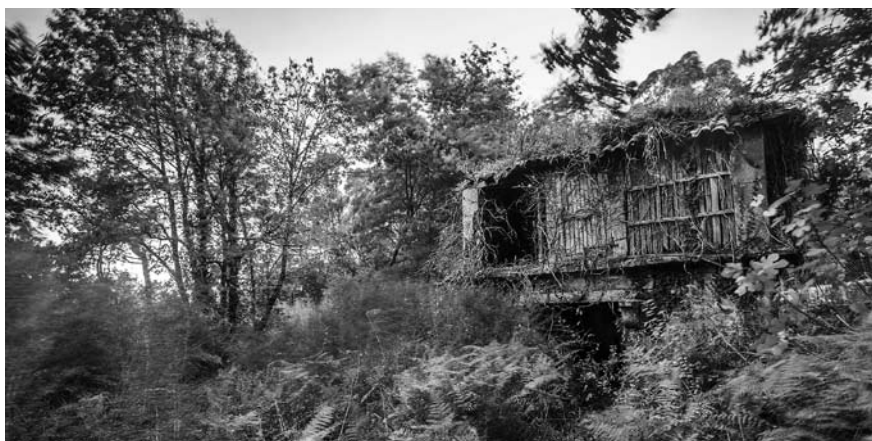
Berres. Antiga hórrea preto da igrexa e da reitoral.

roquial: coma o pagamento (obrigatorio na práctica) das confrarías ou a discriminación á hora de ocupar un lugar determinado na igrexa (non todos tiñan dereito a sentarse no coro do templo).