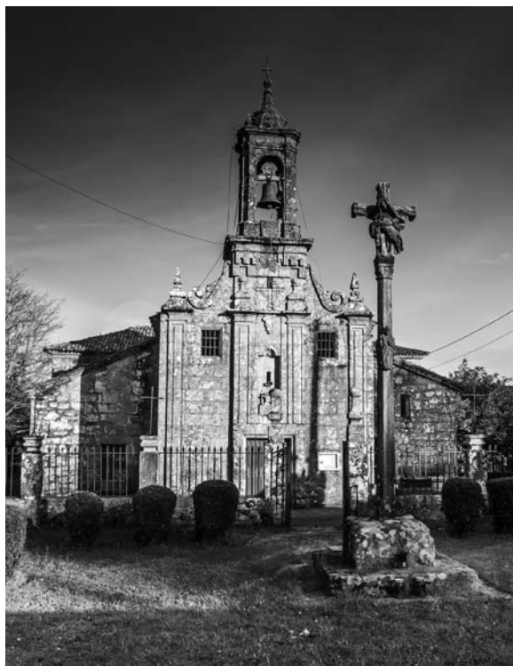
Santo André de Veá. Igrexa parroquial.

estaría así mellor servido, aínda que fose en detrimento dos máis necesitados. Anos despois, na visita arceprestal de 1746, dise que