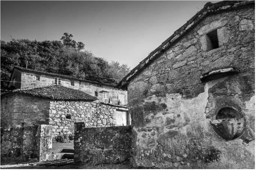
Paradela. Vista da reitoral e da casa escola.

A obra pía por el fundada pretendía a creación dunha escola de primeiras letras para nenos e nenas das dúas parroquias; e tamén unha dotación para as rapazas que casasen cumprindo coas normas morais e relixiosas establecidas nas cláusulas da fundación: os rapaces, ademais de aprenderen a ler, escribir e contar, debían instruírse na denominada doutrina cristiá; e as mozas casadeiras –como veremos– reunir certos requisitos relativos á súa fama e honra. A asignación para a escola era de 50 ducados por ano e outros 50 para a dote de rapazas.