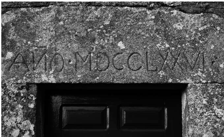
Paradela. Igrexa parroquial. Inscripción con data na lumieira.