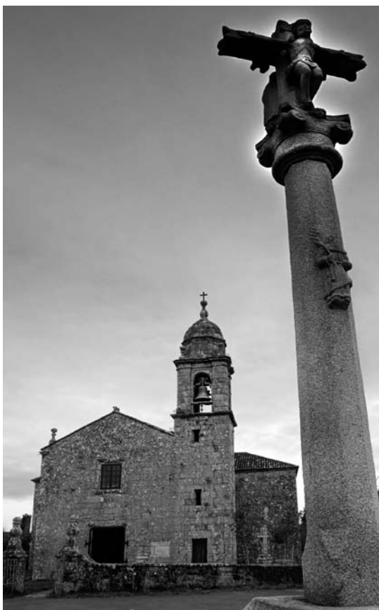
Berres. Igrexa parroquial.

Porque o maior problema para o sostemento desta institución radicaba no reintegro do gran: os primeiros debedores xa son ameazados coa excomuñón na visita de 1627 se non o voltaban no prazo de dez días. Posto que o sistema consistía en prestarlle o gran aos